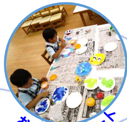
お絵かき・アート