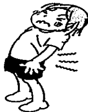
腰をまげたり、反らしたりすると痛みがある