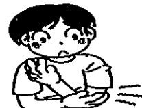
肩やひじの関節に痛みや動きの悪いところがある