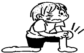
ひざの関節に痛みや動きの悪いところがある