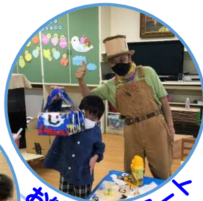
お絵かき・アート (開講予定)