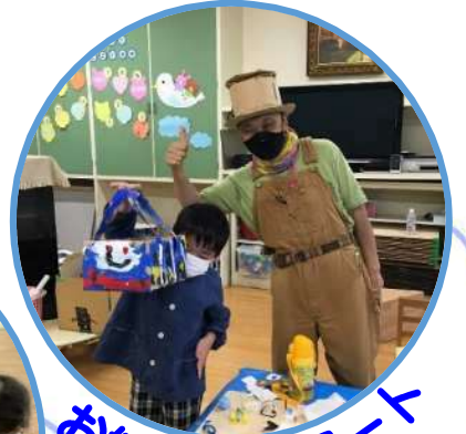
お絵かき・アート (開講予定)