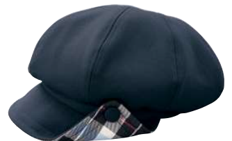
キャスケット X-3150* ○素 材/ポリエステル100%