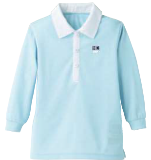
コシノ マリーノ ポロブラウス長袖 X-4430* ○素 材/本体：ポリエステル75%・綿25% 襟部分：ポリエステル65%・綿35%