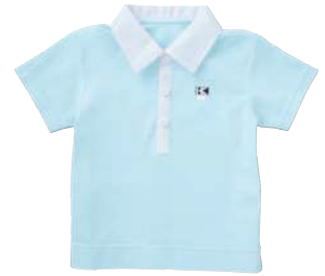
コシノ マリーノ ポロブラウス半袖 X-4440* ○素 材/本体：ポリエステル75%・綿25% 襟部分：ポリエステル65%・綿35%